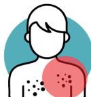
Affection dermatologique, allergie