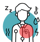
Diabète, hypertension, cholestérol