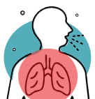
Toux, asthme, bronchite